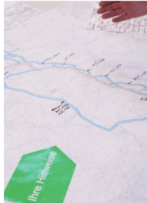
Die Bundesnetzagentur legt die zu untersuchenden Korridore unabhängig fest

Sobald die Antragsunterlagen um diese Untersuchungen und weitergehende Informationen ergänzt wurden, wird die Bundesnetzagentur mehrere Antragskonferenzen ausrichten, an denen auch die Öffentlichkeit teilnehmen kann. Neben Behördenvertretern können dort alle Bürger Hinweise zu den SuedLink-Planungen einbringen und Alternativvorschläge zum potenziellen Verlauf von SuedLink zur Diskussion stellen.